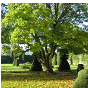
Jardin de la Massonnière

Mobilisation de 125 parcs et jardins du Grand Ouest pour aider la recherche sur les maladies du cerveau... en Bretagne, Basse-Normandie et Pays de la Loire.