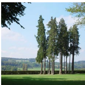
Parc du Château de Lorière