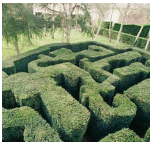
Jardins du château de la Ballue

CONFÉRENCE DE LANCEMENT À QUIMPER (29) : JEUDI 22 AVRIL 11H À L'ORANGERIE DE LANNIRON ET 14H À BOUTIGUÉRY