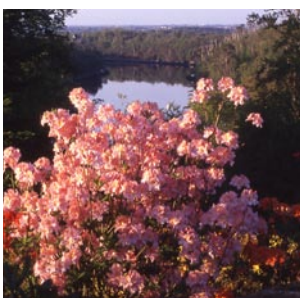
Parc de Boutiguéry