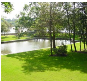
Château de Lanniron